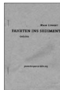
Maik Lippert: Fahrten ins Sediment. Gedichte 14 Seiten, parasitenpresse köln 2003, http://metropolis.de/parasitenpresse.html