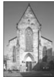
Mark Escherich, Christian Misch, Rainer Müller (Hg.): Erfurt im Mittelalter. Neue Beiträge aus Archäologie, Bauforschung und Kunstgeschichte. 312 Seiten, 111 Abb., Lukas-Verlag, Berlin 2003, www.lukasverlag.com