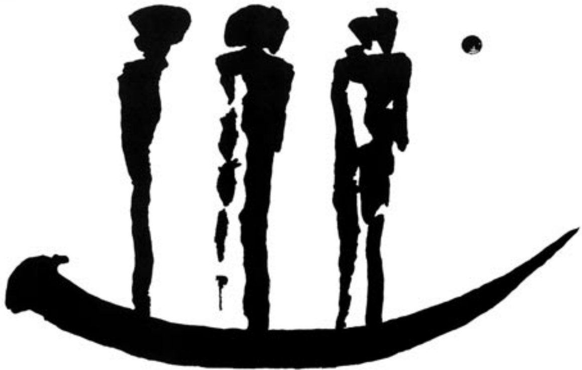
C. D. Spinne: Das Boot was das Schwert ist (1998) Offsetdruck, 48 x 66

habe Hunger, laß uns aber erst arbeiten«, flüstert er mir zu und schnell suche ich die Decke, den Ölradiator und meine Kleider zusammen, lege mich hin und frage, was ich tun soll. Er schaut mich an, begleitet jeden meiner Griffe, das Herabstreifen des Pullovers, das Weglegen des Schals, greift zu einem Pinsel und schleicht von Fenster zu Fenster, läßt die Rolläden herunter, bis nur noch ein fahles, dunkles Licht auf mir ruht. Er sitzt vor mir, ich blicke ihn an. »Du hast zugenommen?« fragt er gleichgültig. »Nein«, sage ich und sehe die zwei unbekanntenen dünnen Frauenbilder vor mir tanzen.