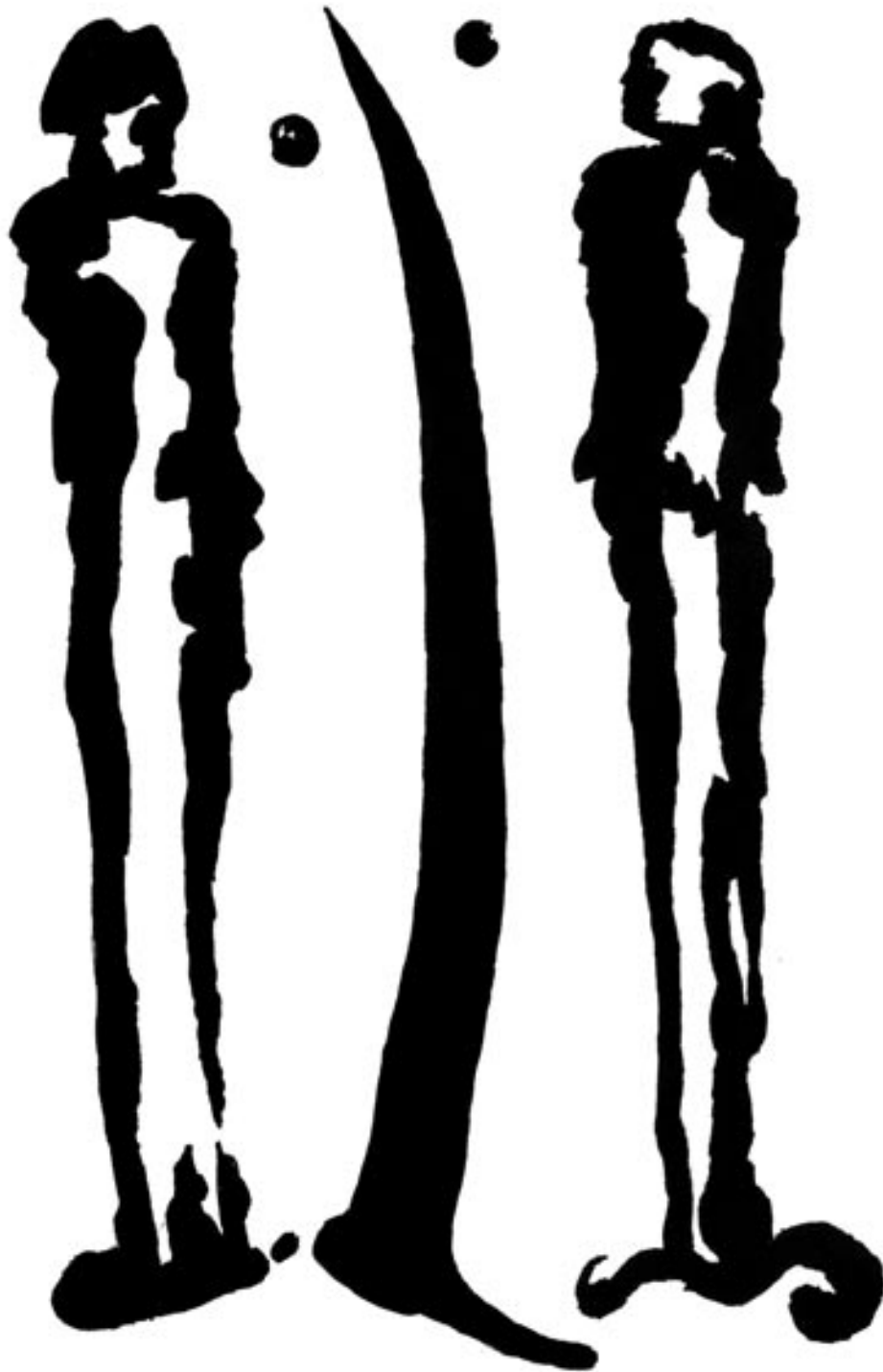
C. D. Spinne: Das Schwert was das Boot ist (1998) Offsetdruck, 66 x 48 Jg. 1965, lebt in Erfurt