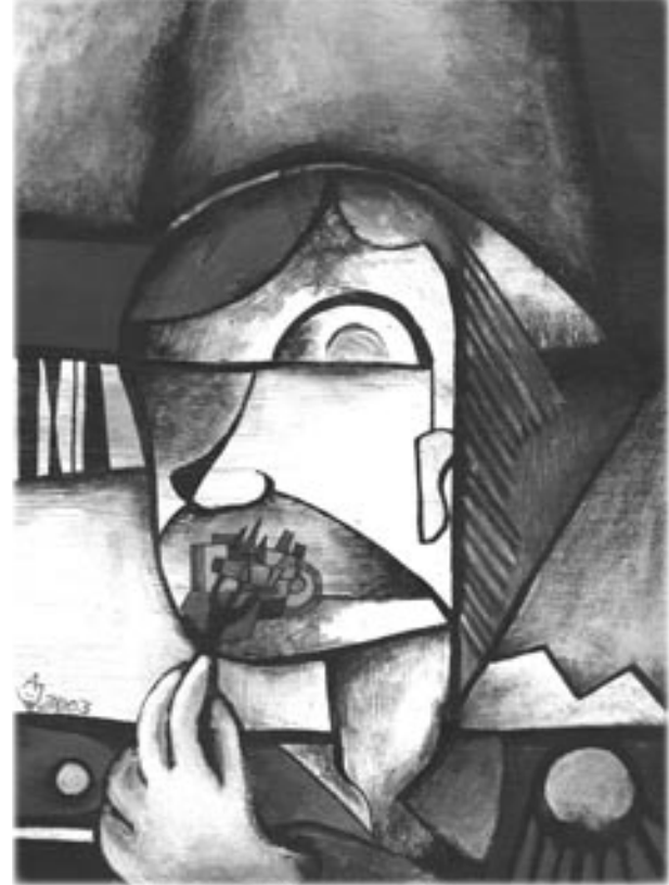
Janek el Cäsard: Kulturgendarm. Acryl auf Leinwand

Es ist zwar schon eine Weile her, aber es ist ja an und für sich nicht ungewöhnlich, daß einem manchmal bestimmte Dinge von Zeit zu Zeit den Appetit verderben, weil sie wochenlang zwischen Schließmuskel und Magenpförtner herum grummeln. Letztlich kann man dann nur froh sein, daß sie sich – wenn auch verspätet – wieder heraus trauen. Bisher sind mir zwei öffentliche Kritiken zu diesem wunderbaren Organ, Die Rampensau, zu Ohren gekommen.